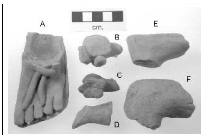
Figure 2. Ceramic sculpture fragments from Yautepec.

to two sites. I suspect that such figurines were much more widely distributed, but without access to numerous museum collections, one will never know.