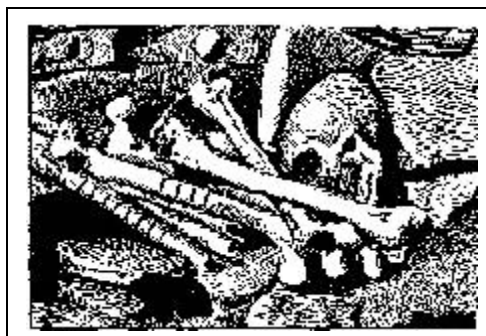
Figure 4. Secondary burial with notched bones from Calixtlahuaca (from García Payón 1941:67).

A final example is notched human femurs. Figure 4 shows samples from a secondary burial excavated by José García Payón (1941) at Calixtlahuaca. There is a literature on these objects, and aspects of their symbolism and use are relatively well understood (e.g., Beyer 1934; Carballal Staedtler, et al. 1993; García Payón 1941; Seler 1992). Nevertheless, their geographical distribution is not well known. Numerous examples are known from Late Postclassic sites in the Toluca Valley (and from Michoacán), but only one fragment has been found at contemporaneous sites in Morelos. Is this difference in occurrence culturally significant, or is it an accident of excavation and publication? I am sure that if the various examples of notched bones in museums were recorded and studied, patterns of their distribution — and their cultural significance — would become much clearer. The Morelos fragment is from my excavations at Yautepec, but I have no idea whether this find is unique and surprising, or whether it is just one more example of a widespread, but poorly documented, distribution.